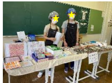
↑ 7 月 20 日の板橋特別支援学校夏祭りに 出店しました