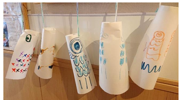
4 月下旬、ハイホーの廊下にアートの時間に作った鯉のぼりが並んでいました